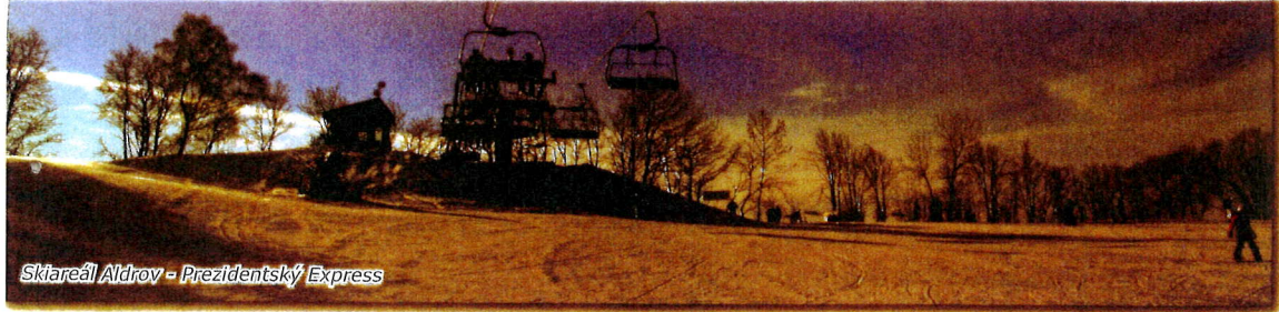
Skiareál Aldrov - Prezidentský Express