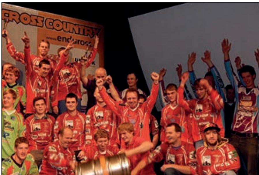
Jilemnická radost z obhajoby prvenství mezi kluby v seriálu KTM ECC